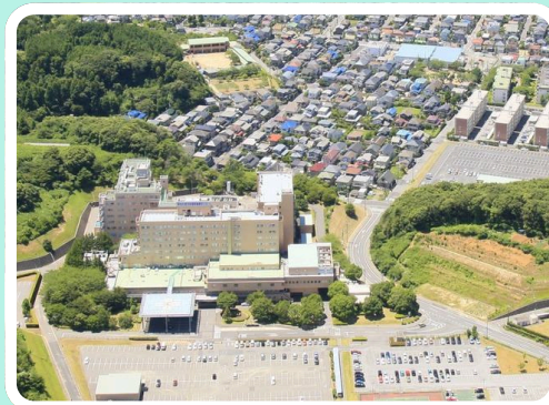
ちば総合医療センター